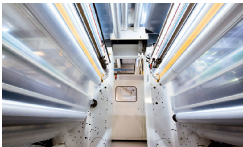
Dettaglio di un estrusore visto dall'interno